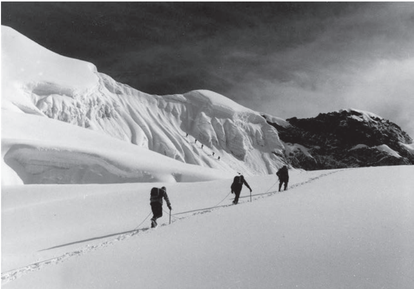
Nepal, Aufstieg zum Yala Peak